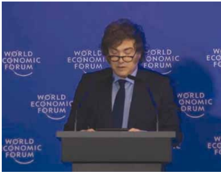
Milei, confía en llegar a la calificación de Investment Grade

En ese sentido recalzó: “Estamos corrigiendo el orden macroeconómico, cueste lo que cueste” y subrayó la implementación de medidas “que sacaron al 90% de la población mundial