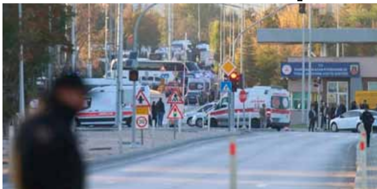
Atentado. En una fábrica aeronáutica turca de Ankara

En el asalto murieron cinco personas, además de los dos asal-