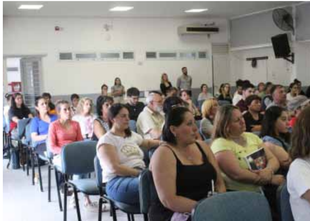
Una imagen parcial de la concurrencia, importante pese al mal estado del tiempo.

tos que contribuirán al crecimiento y fortalecimiento de la comunidad emprendedora local.