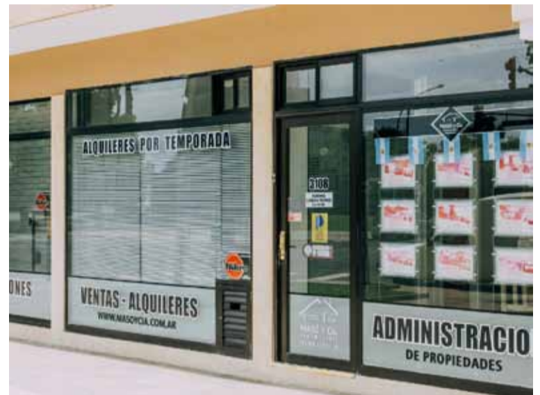
Recuperación. En septiembre hubo una fuerte suba de escrituraciones

En septiembre, hubo 705 escrituras formalizadas con hipoteca. Por lo que la suba en ese sentido es del 317,2% respecto al mismo mes del año pasado y del 74,3% en el acumulado del año (1970 escrituras de hipoteca en total).///