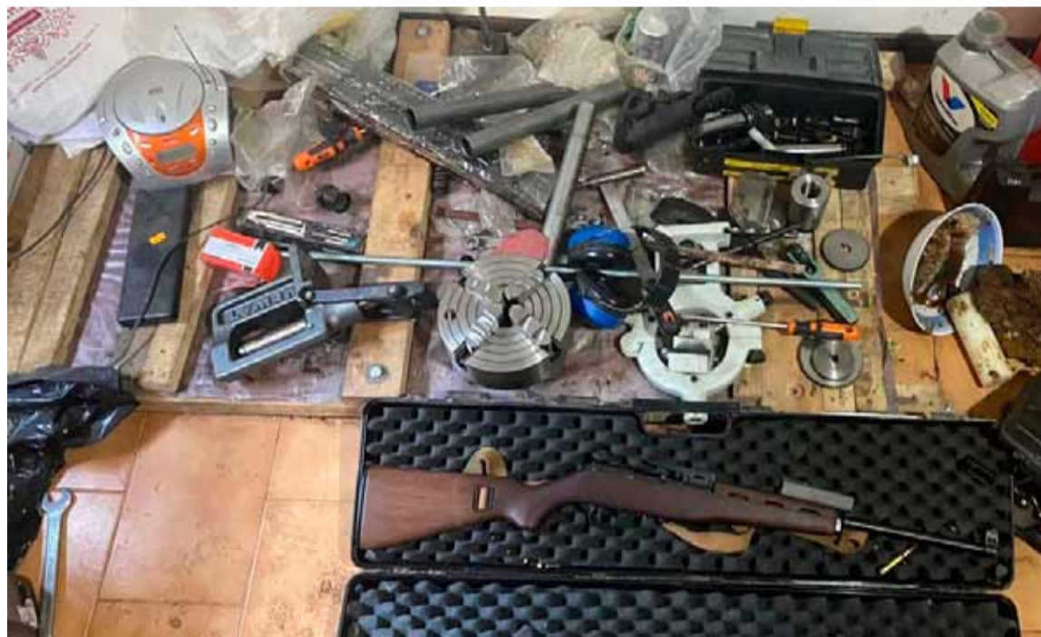
Tráfico de armas. Importante cantidad de armas secuestradas en 30 allanamientos

Ocho personas fueron detenidas en más de 30 allanamientos por el tráfico de armas, en el marco del "Plan Bandera" implementado por el Ministerio de Seguridad de la Nación para combatir los delitos en Rosario, Santa Fe.