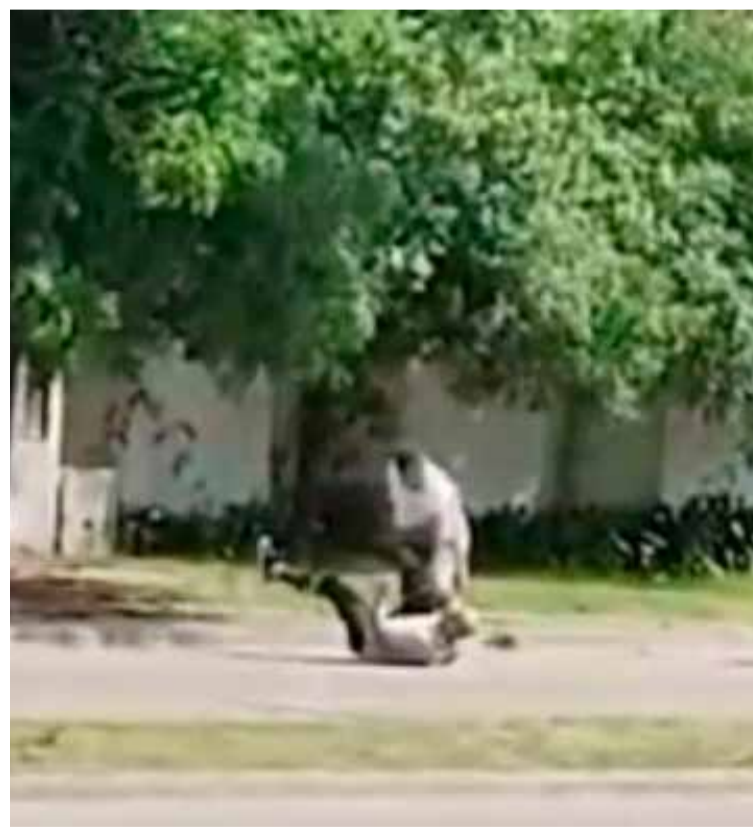
Irracional. El momento de la pelea

Voces policiales informaron que con la asistencia de testigos pudieron dar con el implicado en la zona de 155 y 520. Allí, aprehendieron al acusado y secuestraron la camioneta en la que circulaba. Comerciante, el autor de las agresiones con arma blanca fue imputado por "homicidio en grado de tentativa". (DIB)