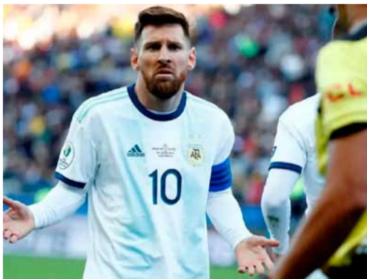
Engaño. Utilizaron una entrevista de Messi para promocionar una empresa de trading

“Si tenes 75.000 pesos en una semana se convierten en 2 millones de pesos. No necesitas ser un experto en economía ni en mercados”, expresa el supuesto Messi. La noticia sobre este deepfake comenzó a circular por redes sociales luego de que el periodista Maximiliano Firtman haya contado que a un conocido