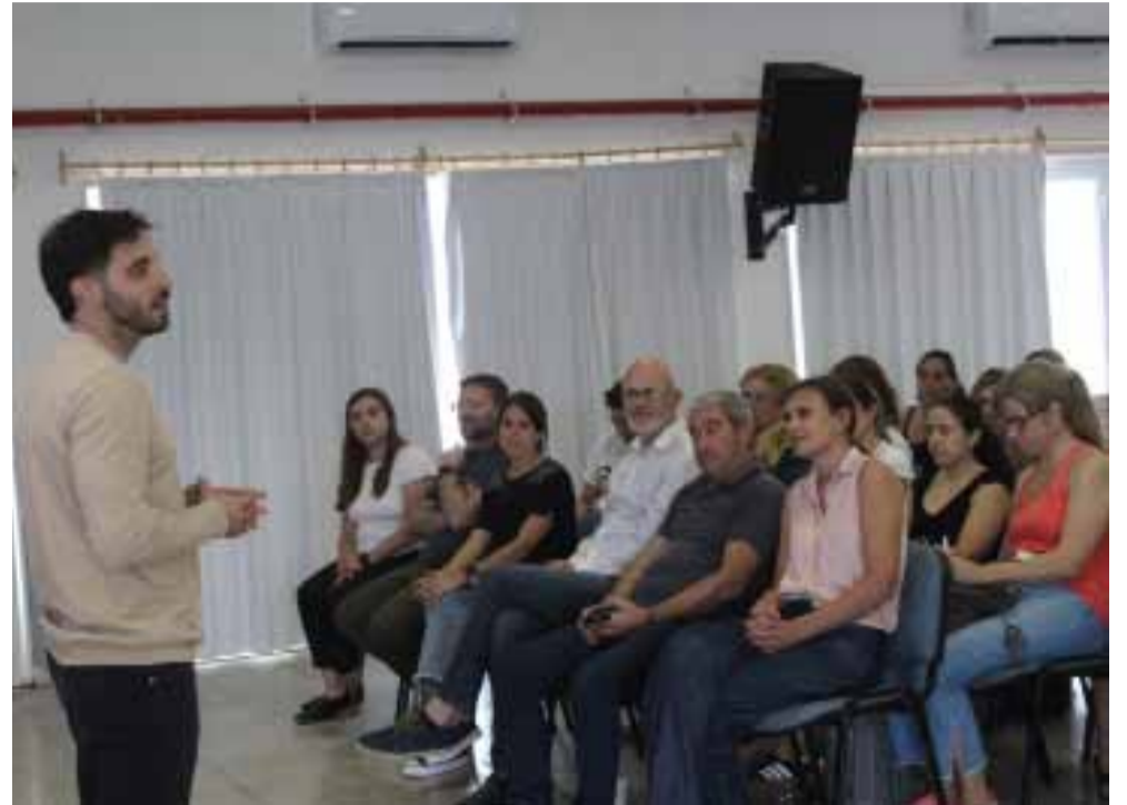
El capacitador de la UNICEN y en primera fila funcionarios municipales y concejales, además de representantes de instituciones.

La Municipalidad de Bolívar invita a todos los emprendedores y funcionarios municipales a participar de estas capacitaciones, que representan una oportunidad única para adquirir nuevas herramientas y conociemien-