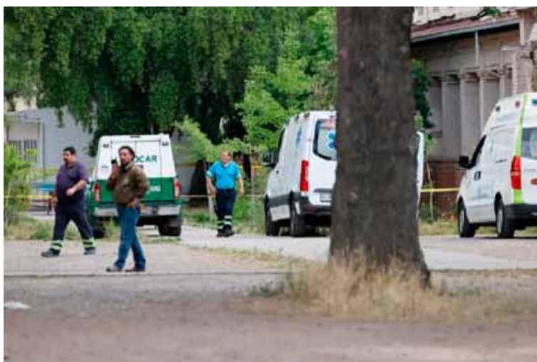
En un colegio. 35 alumnos resultaron heridos, cuatro de ellos están graves

El Internado Nacional Barros Arana, también conocido por su